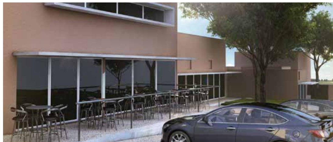
Inspirado para atender profissionais em busca de comodidade, facilidade de acesso e estacionamento próprio e conta com a melhor vista de Araras

Outro espaço exclusivo desse empreendimento é o Sam.Co Working, uma modalidade de trabalho que pode ser compartilhada por profissionais e empresas a um custo bem mais acessível tendo como