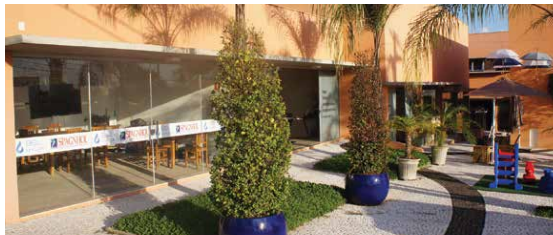
O Boulevard Samantha abriga um mix para várias atividades comerciais ou prestadores de serviços

O Boulevard Samantha, localizado entre os Jardins Samantha I e II, é um empreendimento da Copec Urbanizadora, que nasceu com um conceito inovador para ser um centro de compras, lazer e entretenimento, oferecendo conforto, interatividade e segurança.